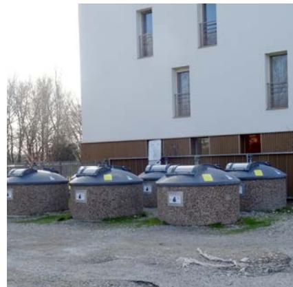
Une caméra sera posée devant les collecteurs près de la Vorgine.

finances, a ensuite présenté des modifications au budget principal pour notamment assurer le dégrèvement de foncier non bâti aux jeunes agriculteurs. Une convention a été sollicitée pour assurer l'éventuel déneigement de l'hiver 2021. Michel Gounon a demandé une autorisation de dépenses d'investissement à hauteur de 106288 € à valoir sur le budget 2021 (50000 € pour la halle des sports, 20000 € pour la voirie et 11800 € pour le lotissement fourches vieilles). Frédéric Giranthon sera remboursé pour l'achat de gel hydroalcoolique pour les écoles et du matériel de sécurisation pour la voirie (126,80 €). D'autre part, la station de camping-cars installée sur le camping municipal pourrait accueillir les cyclistes de la ViaRhôna. Le conseil s'est poursuivi à huit clos.