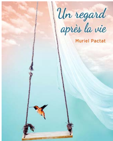
Un roman initiatique à la portée de tous.