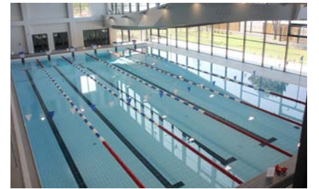
Les bassins fin prêts à recevoir le public autorisé.