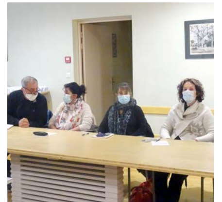
Les conseillers municipaux sont autour de la table lors du conseil de mardi 5 janvier.